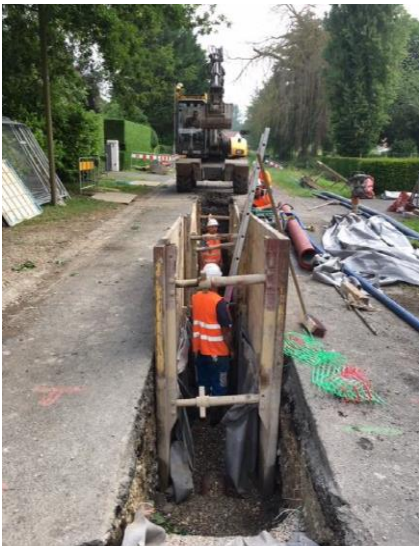
Tranchée rue de l'Eglise