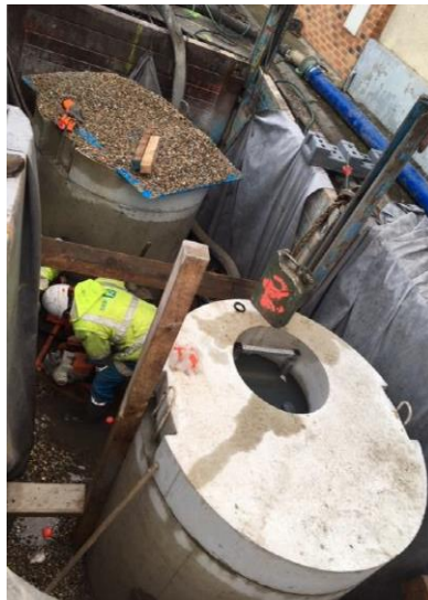
Chambre à vanne et poste de refoulement rue de l'Eglise