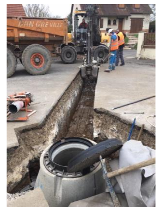
Rue de la Garenne